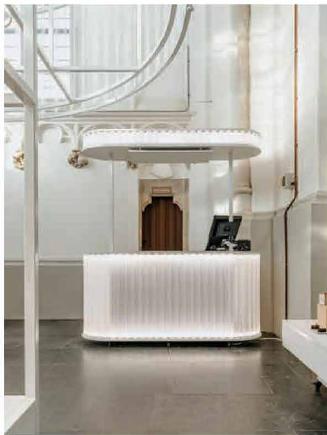
FOTO ONDER De verrijdbare kassabalie kan bij het sluiten van de Citystore binnen de transparante huls geplaatst worden.

MIDDEN Plattegrond Citystore in gesloten toestand.