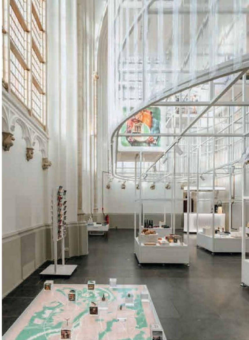
FOTO LINKS De Citystore Arnhem bevindt zich in de Raadskapel van de Eusebiuskerk.