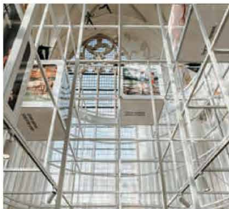
FOTO ONDER Het raster rust op vier poten, die samen met de verrijdbare tafels ruimte bieden voor de verschillende waren die in de Citystore verkrijgbaar zijn.

van de kerk als massief object, waar door de eeuwen heen verschillende meubels in zijn gebouwd: het orgel, de preekstoel, het praalgraf van Karel van Gelre. Wij wilden hier een hedendaags monumentaal meubel aan toevoegen." In de hoge witte kapel zou een massieve constructie de serene uitstraling al snel verstoren; KRAFT architecten en Studio met met bedachten daarom een rank stalen raster dat lijkt te zweven in de ruimte, en de aandacht als vanzelf leidt naar het kunstwerk ter herinnering aan Operation Market Garden – negentien parachutisten die hoog in de kapel hangen.