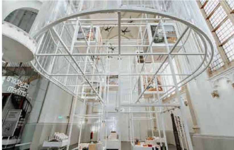
FOTO BOVEN KRAFT architecten en Studio met met bedachten een rank stalen raster dat lijkt te zweven in de ruimte.