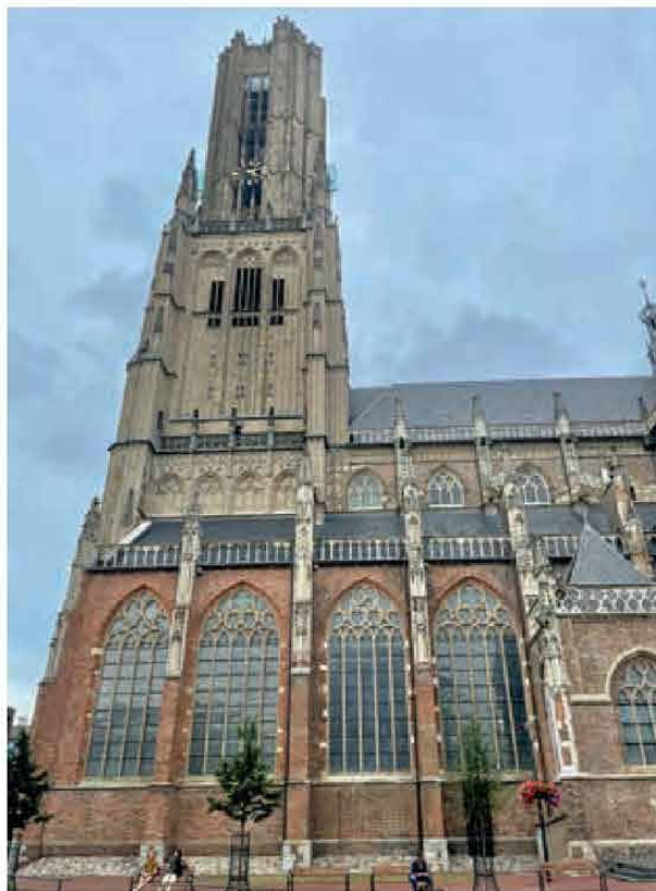
FOTO ONDER De Eusebiuskerk dateert uit de late middeleeuwen.

TEKST Eva Vroom