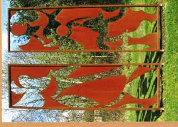
Openheid - Geslotenheid

Ik zou willen zweven, als een vlinder, op de wolken, hoog boven de zee, naar een eiland, met prachtige bloemen, en de vlinder die vliegt met me mee, kijkt over de horizon ginder, zwevend in de stralen van de zon, ik zou willen dat ik dat kon