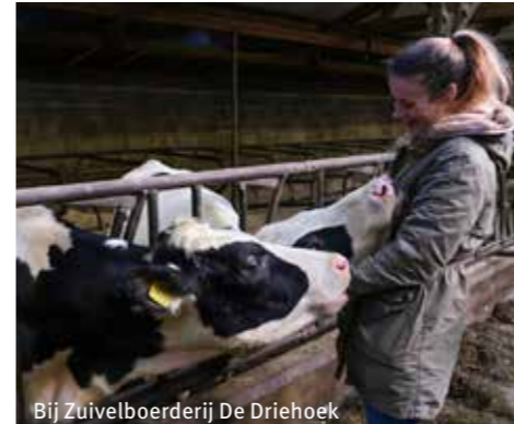
Bij Zuivelboerderij De Driehoek