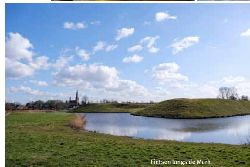
Fietsen langs de Mark