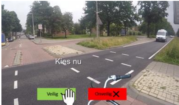
Figuur 4. Screenshot filmpje toetsonderdeel Oversteken.