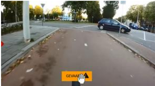
Figuur 2: screenshot filmpje toetsonderdeel opletten.