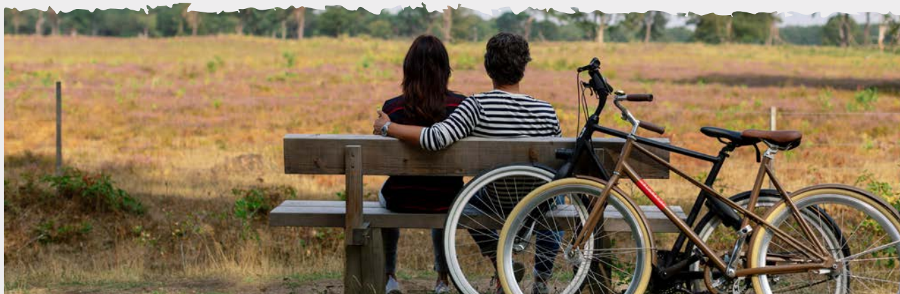
TABEL 1: Besteding per nacht per accommodatietype in Drenthe en Nederland, 2018–2020.