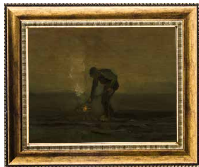
Onkruid verbrandende boer (1883, Van Gogh Museum, Amsterdam / Drents Museum, Assen)