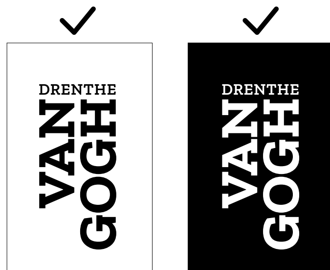
De labels voor zwart-wit gebruik.