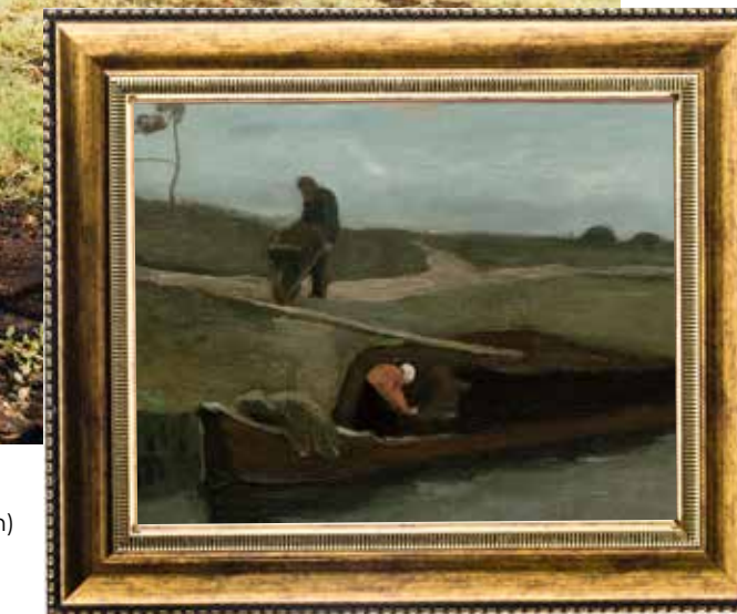
De turfschuit (1883, Drents Museum, Assen)