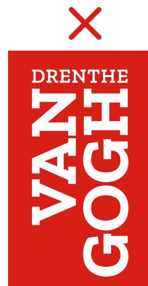
De ruimte om het logo klopt hier niet. Altijd het geleverde label logo gebruiken