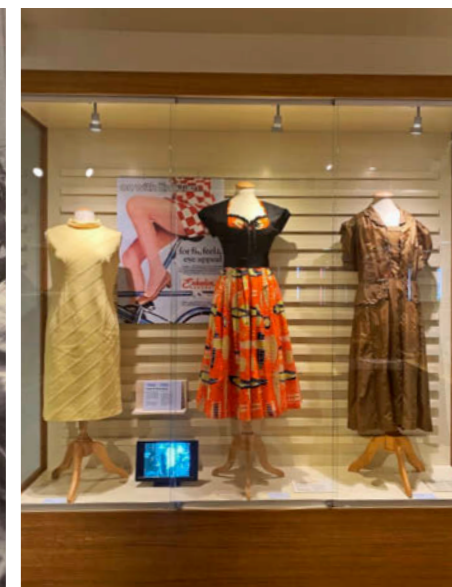
Tentoonstelling 100 jaar Enka, mode in beeld

als we uitstappen en langs stalen driehoeken wandelen die ons naar dat middelpunt leiden (steeds staat aangegeven hoeveel meter het nog is), is er geen ruimte meer voor twijfel. Grote hoogteverschillen hier, dit is een gebied van stuwwallen. We wandelen richting uitkijktoren De Koepel, een rijksmonument. Het is 22 meter hoog. Het hele gebied overzien vanaf hier is een mooie afsluiter van ons avontuur. Middelpuntvannederland.nl