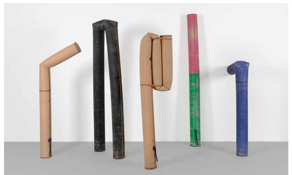
Willy Ørskov, Flexions , 1967 te zien in de tentoonstelling Eerst komt de liefde voor de kunst

RESTAURATIE WALL DRAWING #120 VAN SOL LEWITT 15 okt 2022 - 16 jul 2023