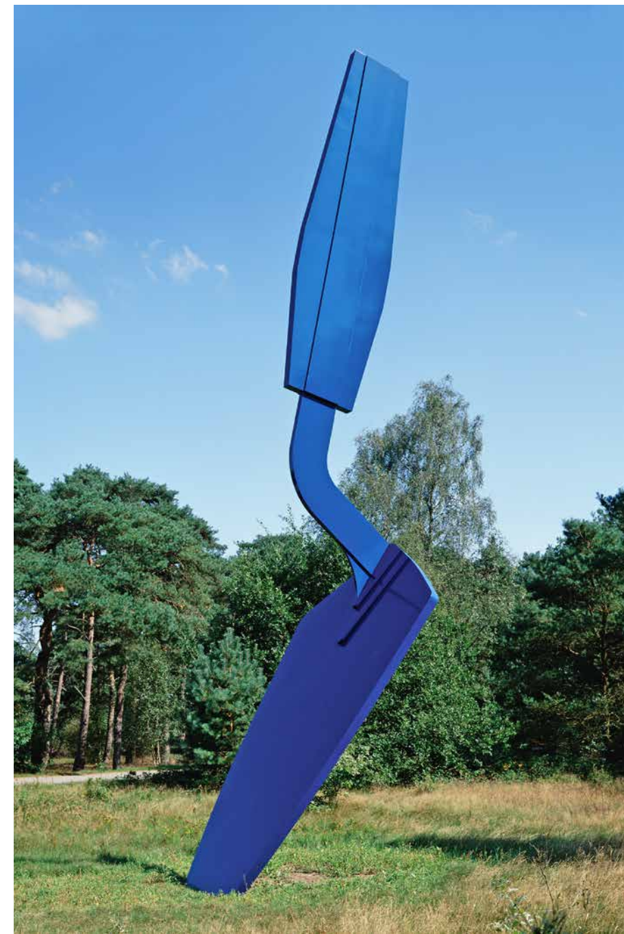
Van links naar rechts: • Marta Pan, Sculpture flottante , Otterlo, 1960-1961 • Claes Oldenburg, Trowel , 1971