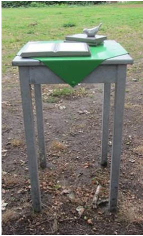
tafel in Heeze-Leende

Onder de titel “Poëzie door heel Cranendonck” gaat de VVV-Cranendonck, in navolging van het project in Valkenswaard en Heeze-Leende, in de gemeente Cranendonck ook een twintigtal zogenaamde gedichtentafels plaatsen.