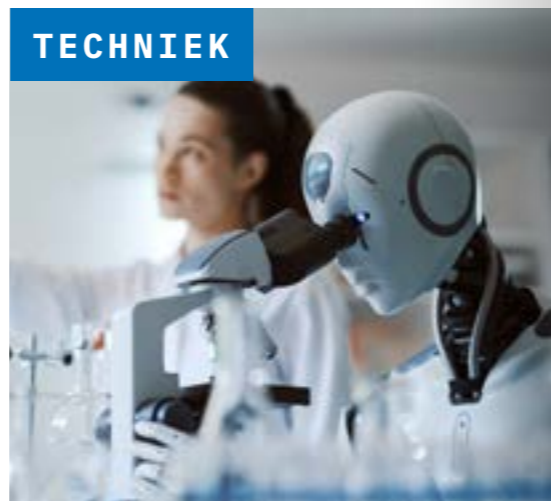
09 Wist je dat? Dit is High Tech Delft