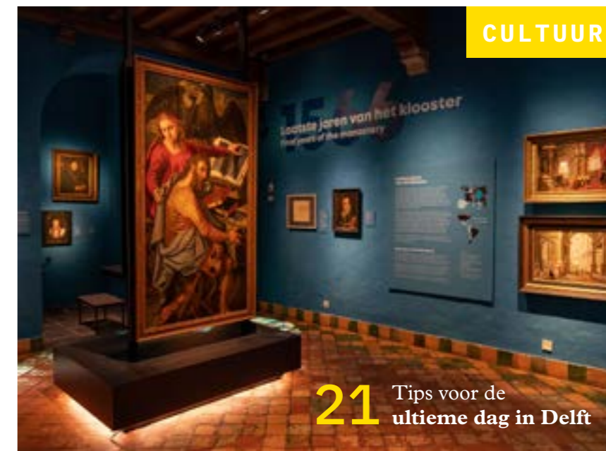
21 Tips voor de ultieme dag in Delft