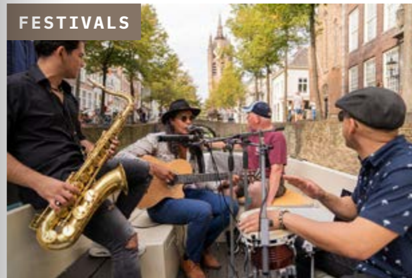
11 Dansen op de gracht