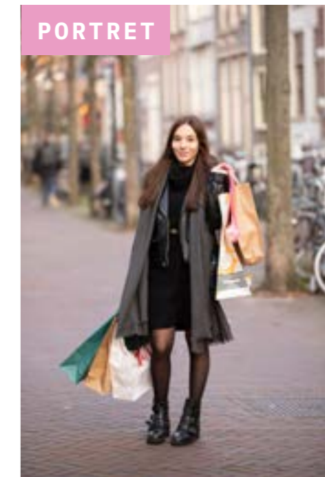
14 'Nadia deelt haar Delftse parels'