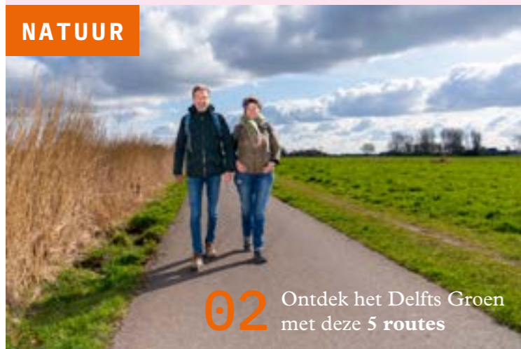
02 Ontdek het Delfts Groen met deze 5 routes

PRACHTIG PODIUM VOOR / Delftse ondernemers, organisaties, musea, horeca & mkb