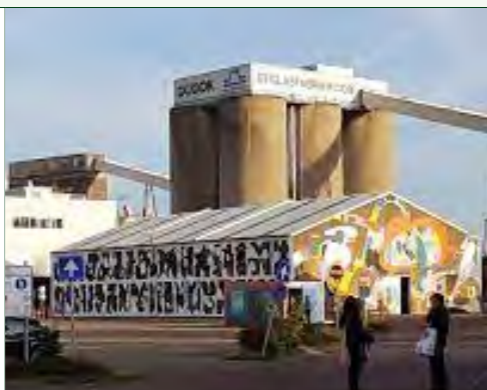
Architect: Reimar von Meding (KAW architecten)

Het historische terrein van de voormalige Schiedamse glasfabrieken wordt omgevormd tot een trendy woon-, beleef- en werkgebied dat gaat bruisen van de energie. Een toffe creatieve hotspot! De 5,5 hectare grote locatie aan de monding van de Schie barst straks van de gezellige woonbuurtjes met horeca-, sport- en speelruimte. En waar kleine creatieve bedrijven naar hartenlust creëren en produceren. Het 'nieuwe' wonen is hier straks voor iedereen mogelijk!