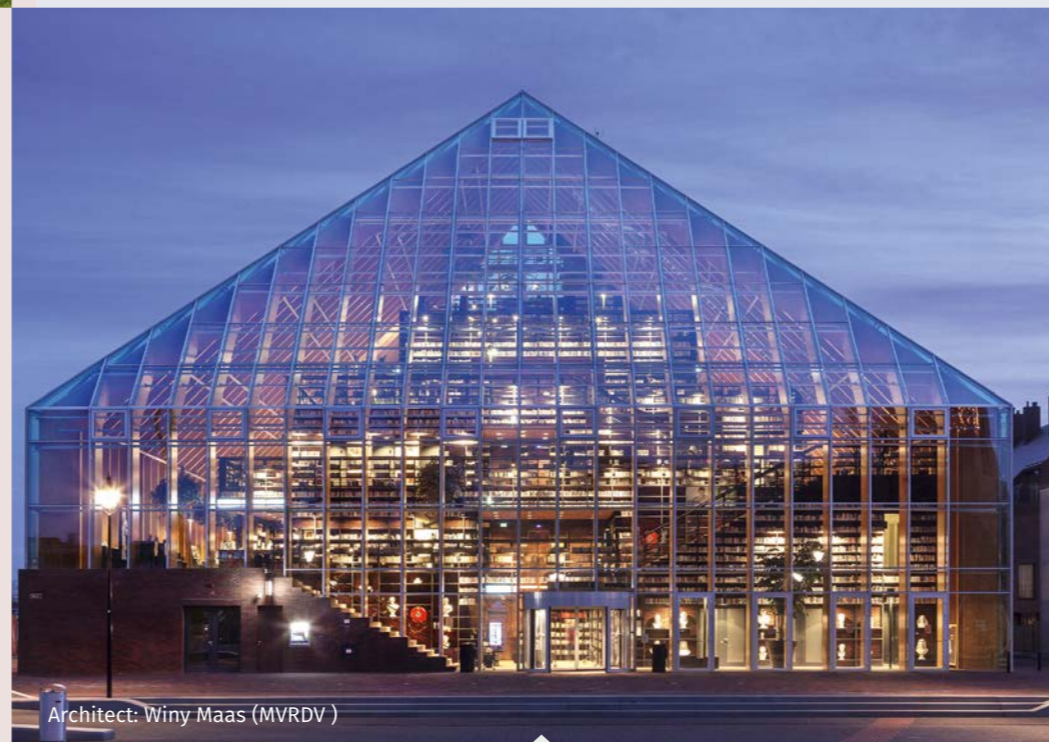
Architect: Winy Maas (MVRDV)