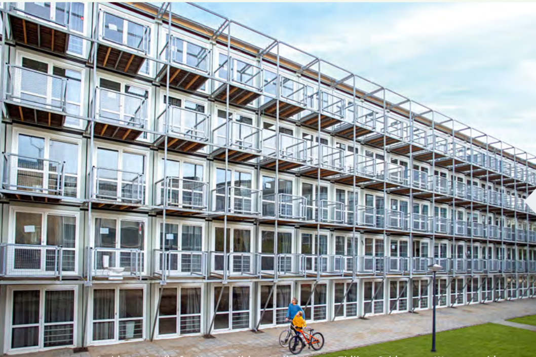
Architect: Studio for New Realities, Atelier Kempe Thill en Schiemann Weyers architects