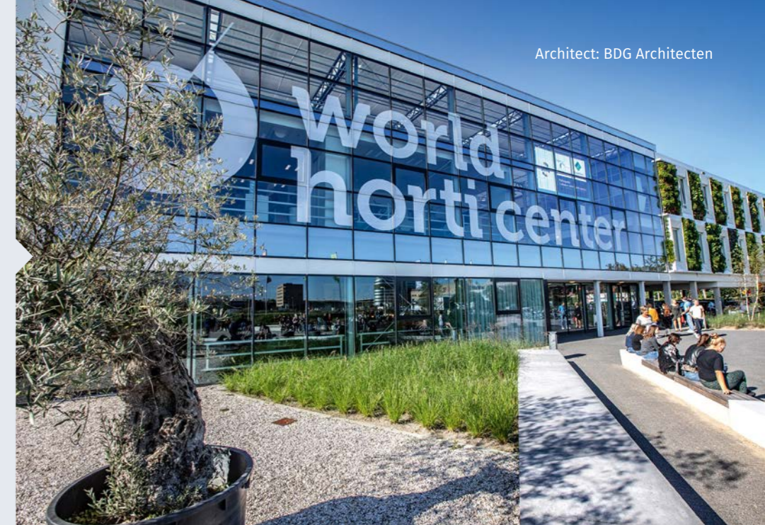
Architect: BDG Architecten