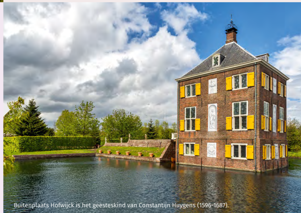
Buitenplaats Hofwijck is het geesteskind van Constantijn Huygens (1596-1687).