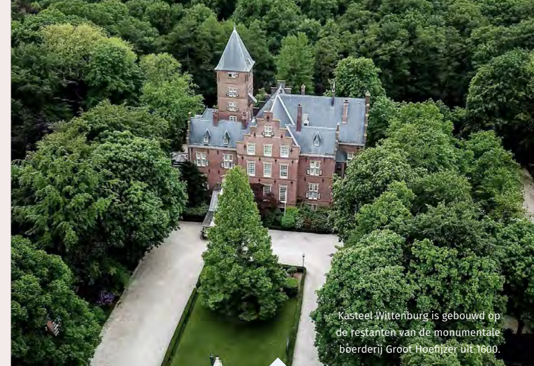
Kasteel Wittenburg is gebouwd op de restanten van de monumentale boerderij Groot Hoefijzer uit 1600.