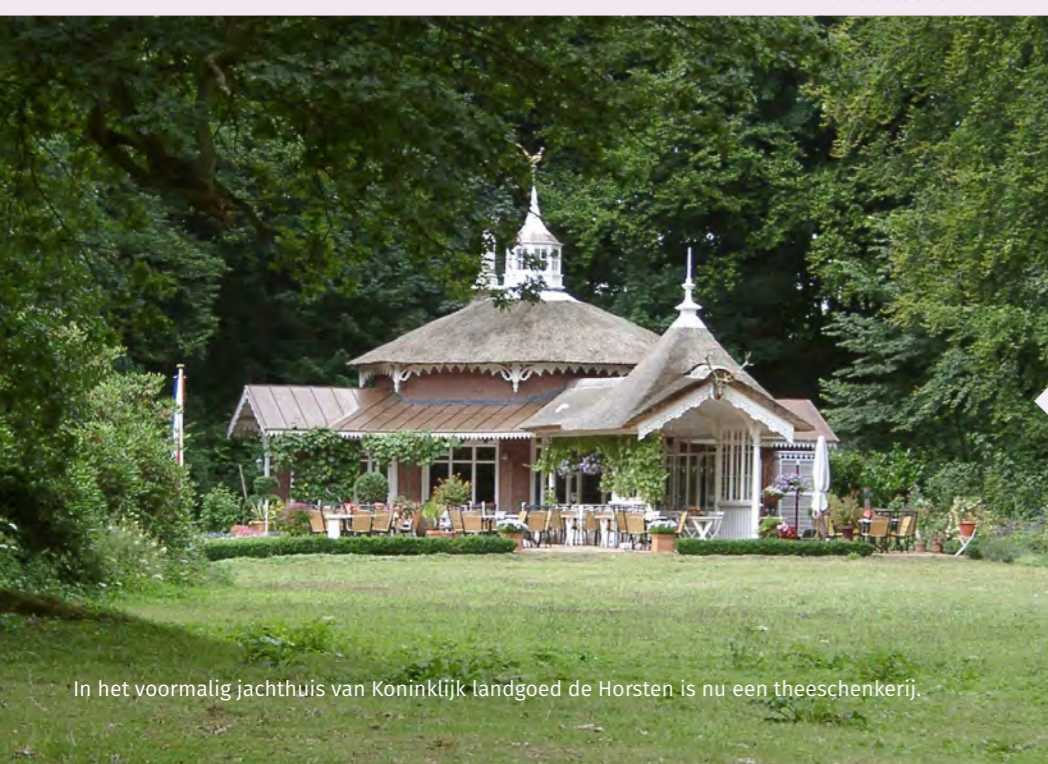
In het voormalig jachthuis van Koninklijk landgoed de Horsten is nu een theeschenkerij.