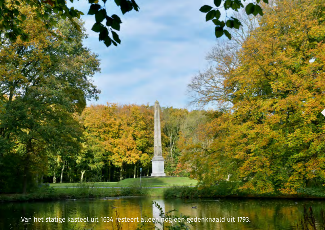
Van het statige kasteel uit 1634 resteert alleen nog een gedenknaald uit 1793.