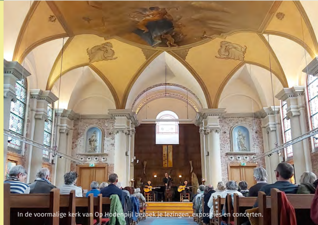
In de voormalige kerk van Op Hodenpijl bezoek je lezingen, exposities en concerten.