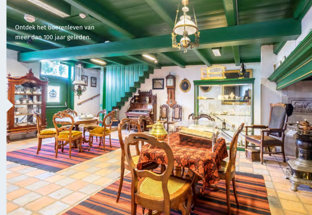
Ontdek het boerenleven van meer dan 100 jaar geleden.