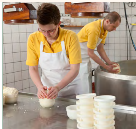
Beleef het platteland bij de kaasboerderij.

Altijd al eens willen weten hoe kaas gemaakt wordt? Beleef het platteland bij de kaasboerderij van de familie Hoogerwaard voor het leukste dagje uit op het platteland en boek hier je arrangement. In de boerderijwinkel vind je de heerlijkste zelfgemaakte boerenkazen en daarnaast tal van andere streekproducten. Op de boerderij is ook een midgetgolfbaan te vinden.