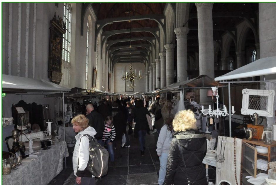
SPW-Brocantemarkt in de Grote Kerk

Bijlagen: Balans en Verlies & Winst SPW (Monnickendam en Marken) 2017 Vernieuwde Missie en Visie SPW (Merkpaspoort 2017)