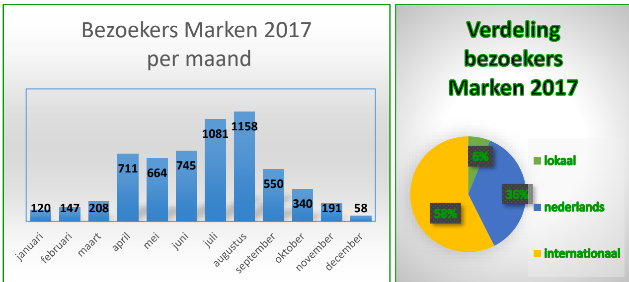
Grafiek 3 en 4. Bezoekers 2017 per maand in Marken ; Onderverdeling lokaal, NL en internationaal