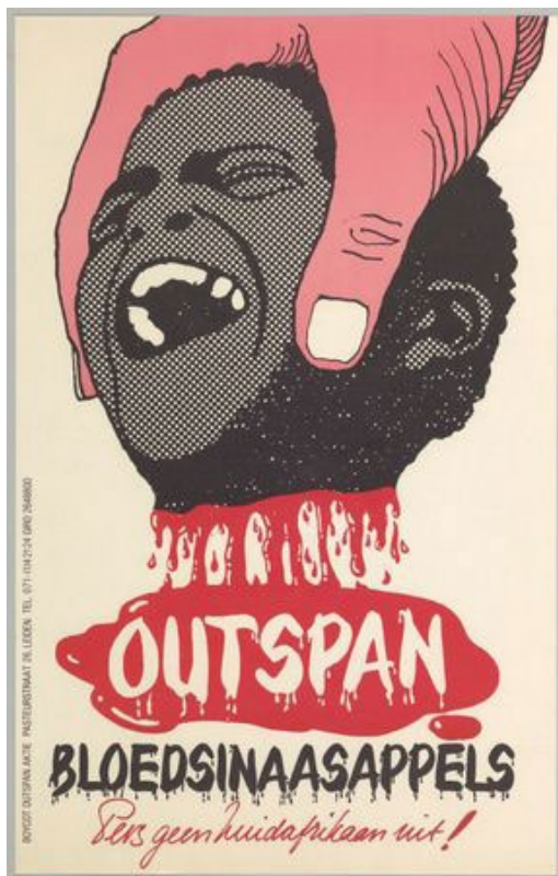
Ontwerper affiche: Rob van der Aa

De Boycot Outspan Aktie werd in 1970 opgericht en hield zich bezig met het bestrijden van het apartheidssysteem van Zuid-Afrika en van racisme in Europa – een ondeelbare strijd volgens de BOA. Oprichter en aanvoerder was Esau de Plessis, die ook kort bij het Afrika-Studiecentrum werkte. In 1992 werd de BOA officieel opgeheven. In 1994 werden de eerste vrije verkiezingen in Zuid-Afrika gehouden.