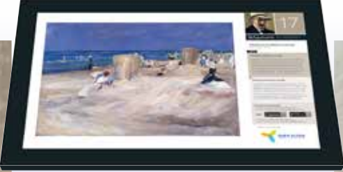
Paneel in kustgebied Tafel in Küstenlandschaft Panel in coastal environment