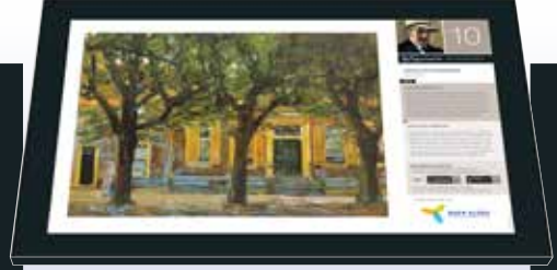
Paneel in bebouwd gebied Tafel in städtische Umgebung Panel in town area