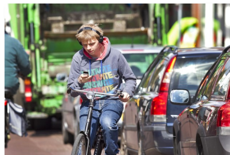
Appen op de fiets