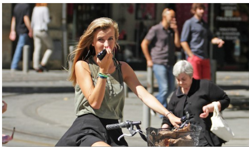
Bellen op de fiets