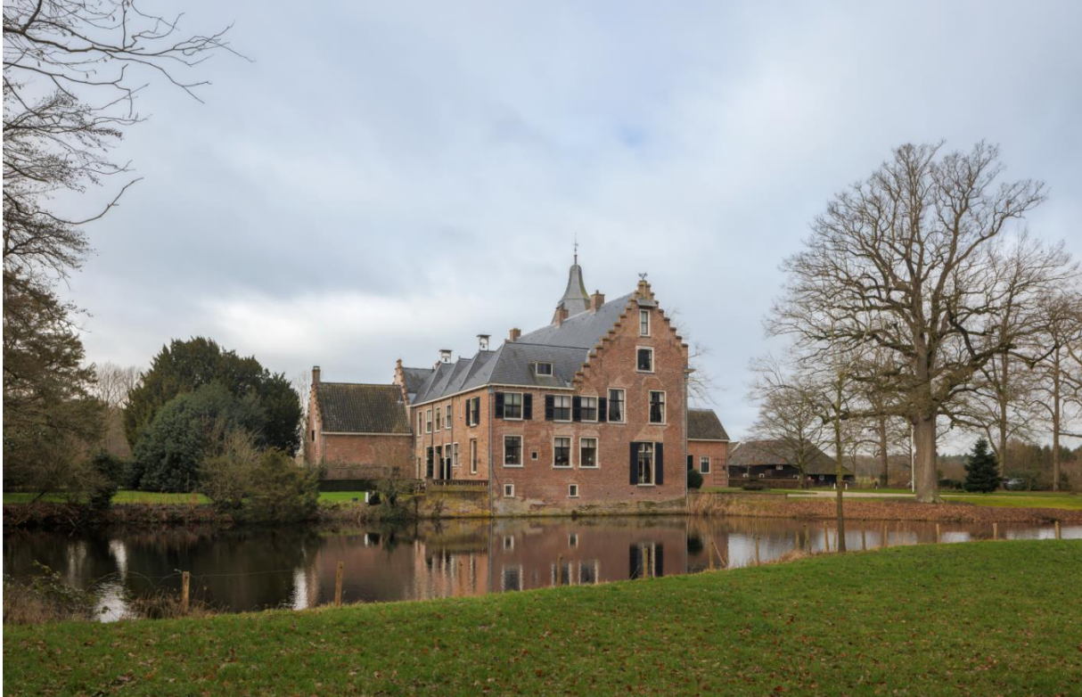
Kasteel Zwijnsbergen Helvoirt

Oisterwijk, 15 februari 2023 - Een team van experts heeft onderzoek verricht naar de plaatsen in Brabant waar Vincent van Gogh opgroeide en zijn ontwikkeling tot kunstschilder doormaakte. Als resultaat van het onderzoek zijn negen nieuwe locaties gekwalificeerd als Van Gogh Monument. Daarmee komt het totaal aantal Van Gogh Monumenten in Brabant op 46. Alle nieuwe inzichten en achtergronden bij de Van Gogh Monumenten en hun betekenis ervan voor het leven en werk van Vincent van Gogh worden gepubliceerd in de Atlas Van Gogh in Brabant. Deze wordt op 30 maart gepresenteerd aan de nazaten van de schilder en is vanaf die datum verkrijgbaar in de Nederlandse boekhandel.