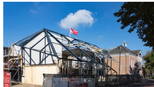
Hoogste punt: 30 september 2022

De vernieuwing en uitbreiding van het museum is tot stand gekomen met hulp van de provincie Noord-Brabant, gemeente Nuenen, ASML, BrabantC, Brainport Eindhoven, BPD cultuurfonds, Mondriaan Fonds en vele certificaathouders.