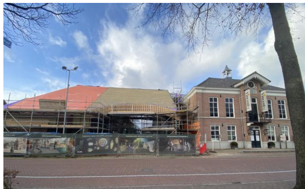
eind december 2022