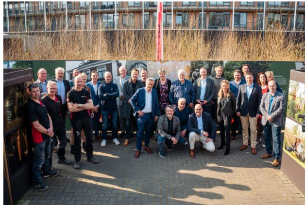
21 maart 2022