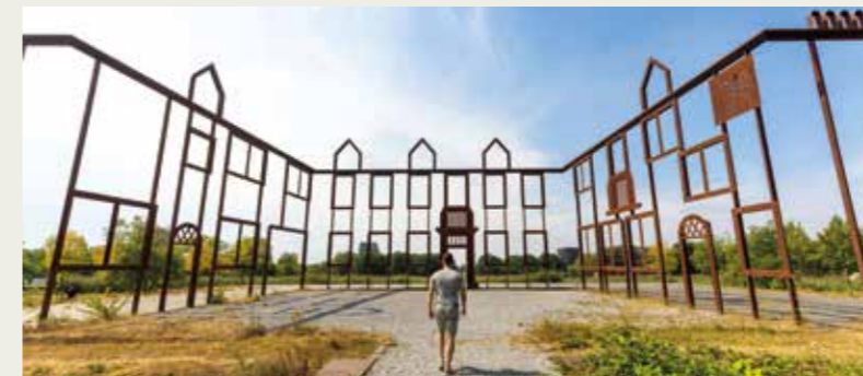
weergave van vier wandelroutekaarten en een beeldimpresie