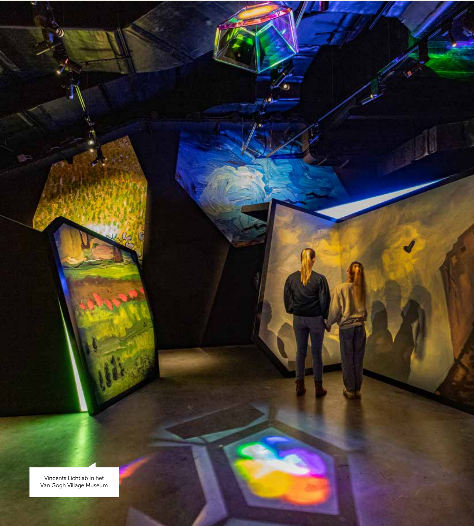
Vincents Lichtlab in het Van Gogh Village Museum