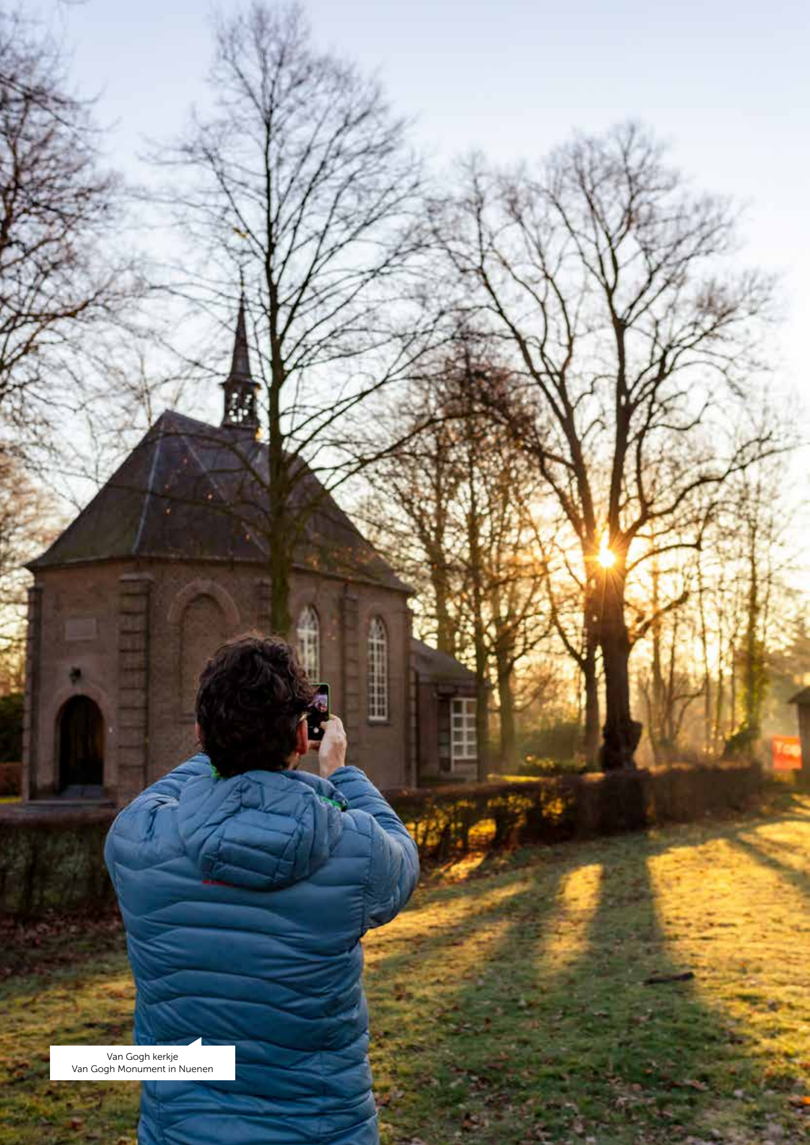
Van Gogh kerkje Van Gogh Monument in Nuenen