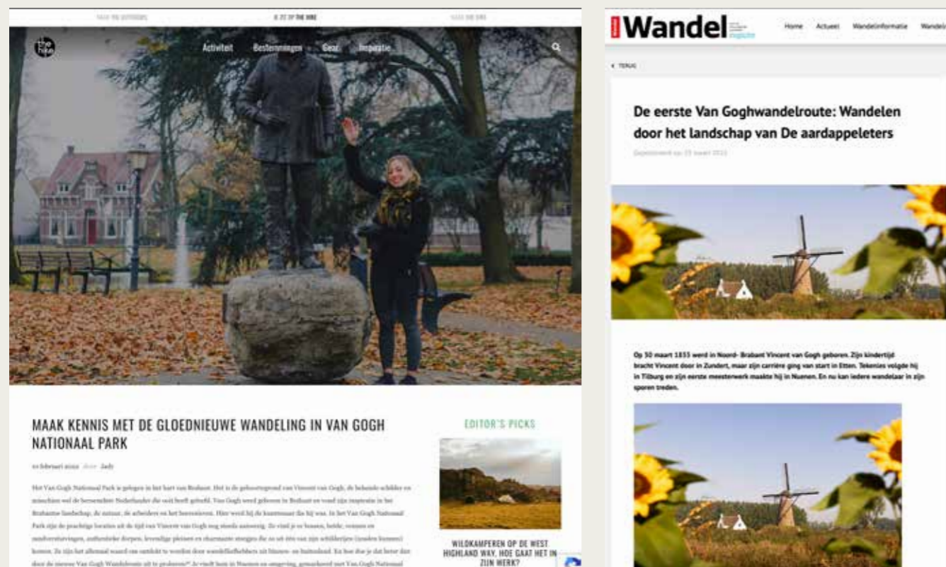
Online weergave Van Gogh routepromotie