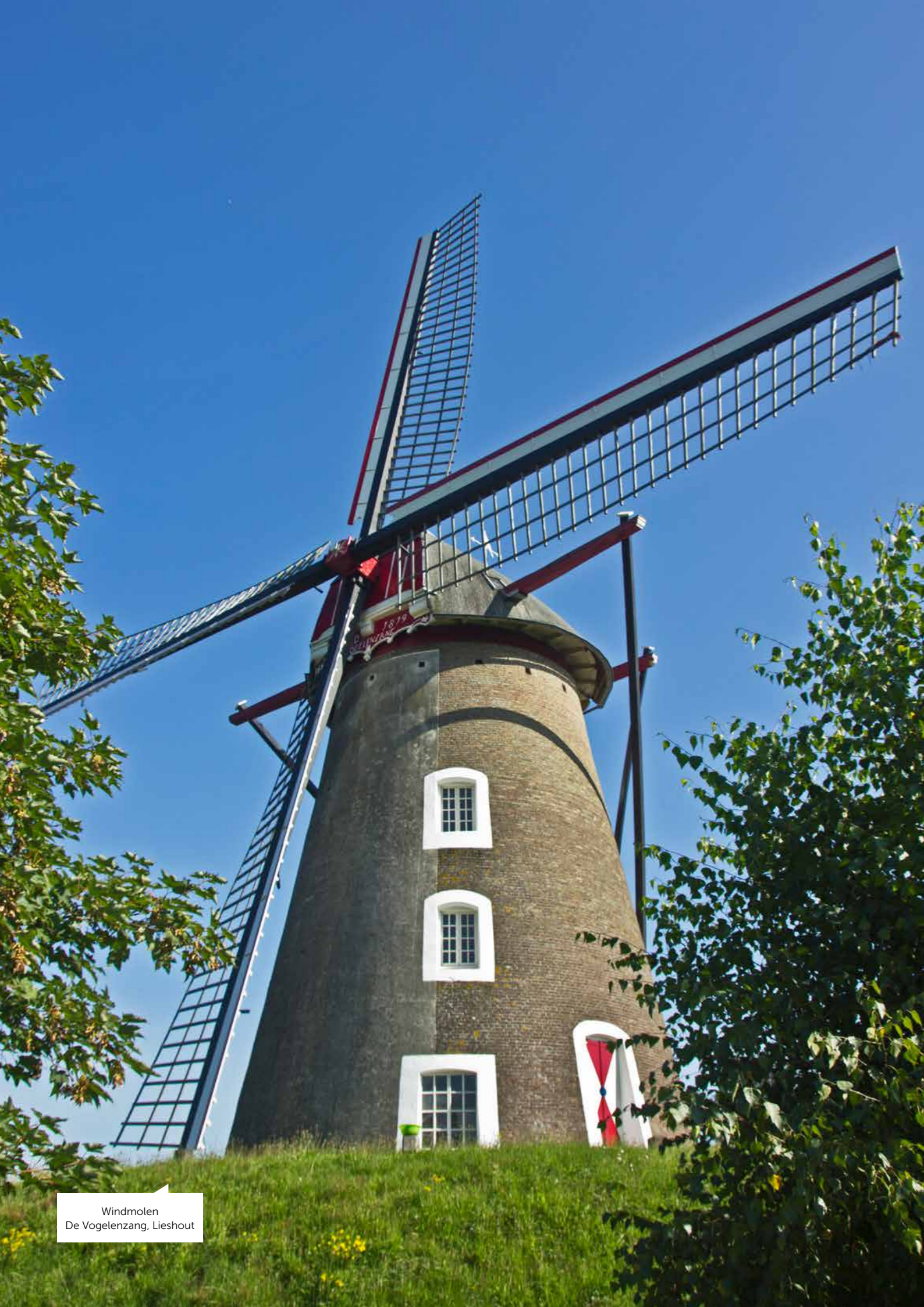
Windmolen De Vogelenzang, Lieshout