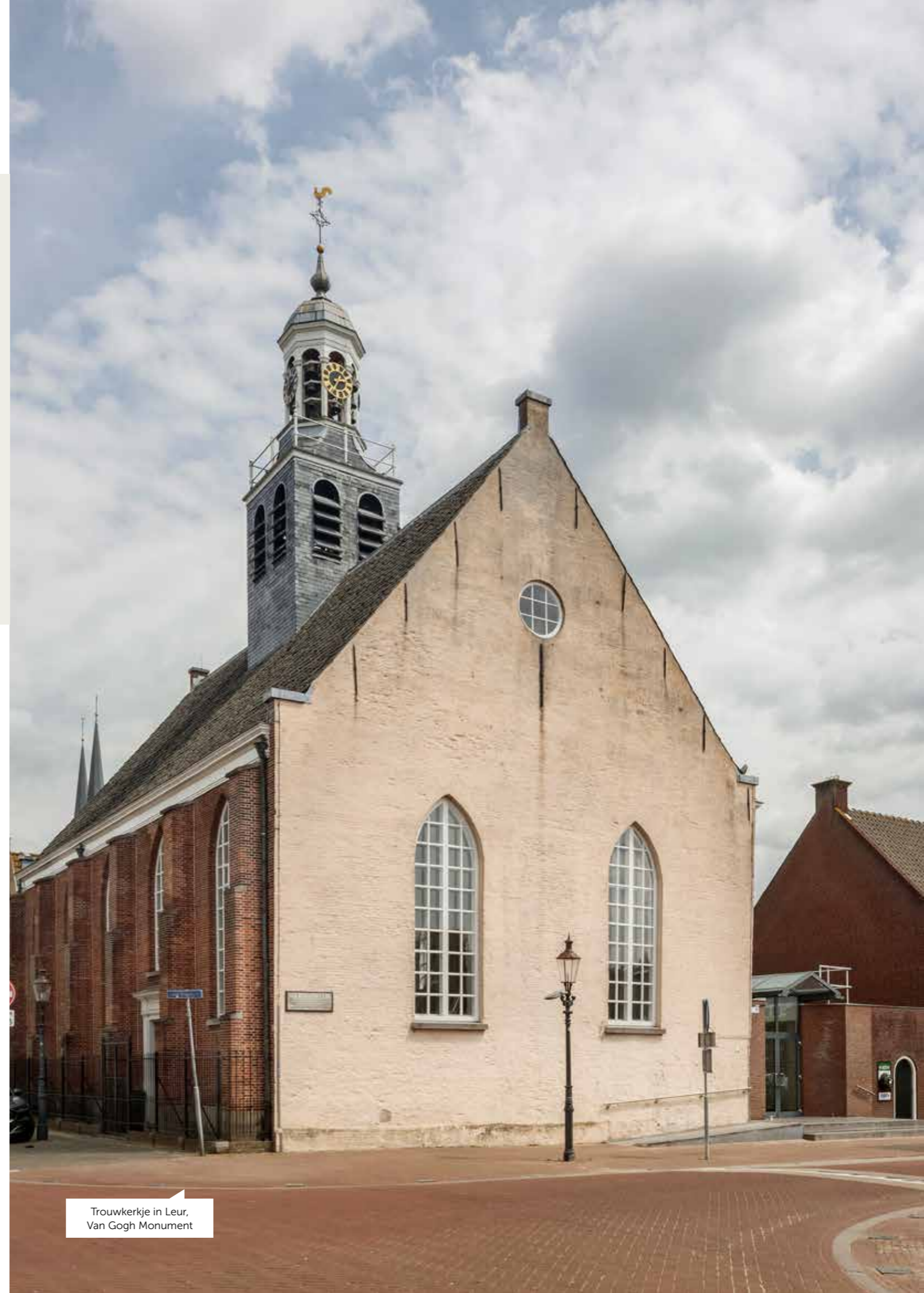
Trouwkerkje in Leur, Van Gogh Monument