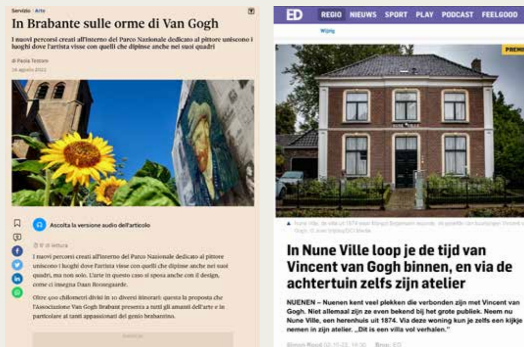
Online (internationale) weergave Van Gogh routepromotie

Pers- en influencerstrategie: ondanks alle beperkingen en de terughoudendheid van de buitenlands media, heeft VisitBrabant zich ingezet voor influencer-marketing. Een overzicht van enkele resultaten hiervan is in dit jaarverslag opgenomen.