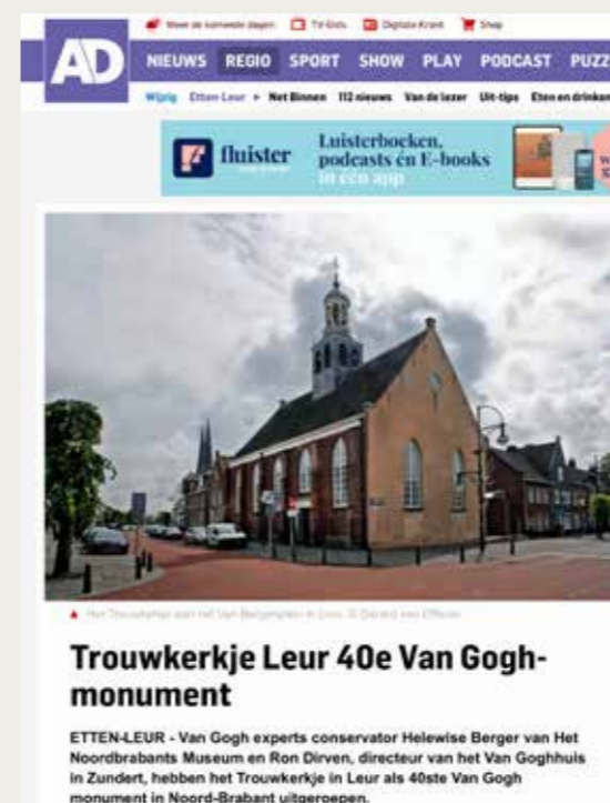
Redactionele aandacht voor nieuw Van Gogh Monument

In het voorjaar van 2023 zal in samenwerking met Het Noordbrabants Museum en Uitgeverij WBooks de Van Gogh in Brabant Atlas worden uitgegeven. Daarin wordt het gehele onderzoek in populaire vorm gepresenteerd.