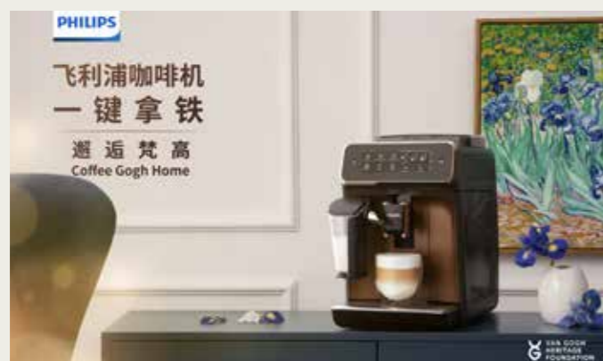
Co-branding campagne van Philips in China