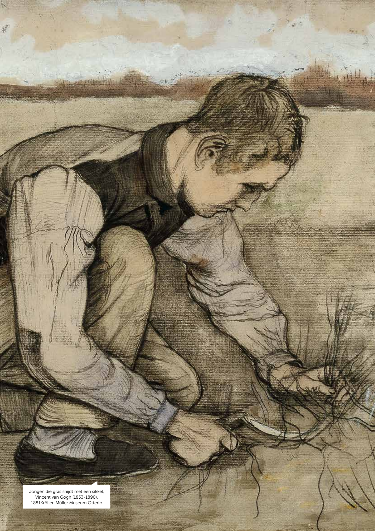
Jongen die gras snijdt met een sikkel, Vincent van Gogh (1853-1890), 1881Kröller-Müller Museum Otterlo

Blijf maar altijd veel wandelen en veel van de natuur houden, want dat is de manier om de ware kunst meer en meer te leren begrijpen