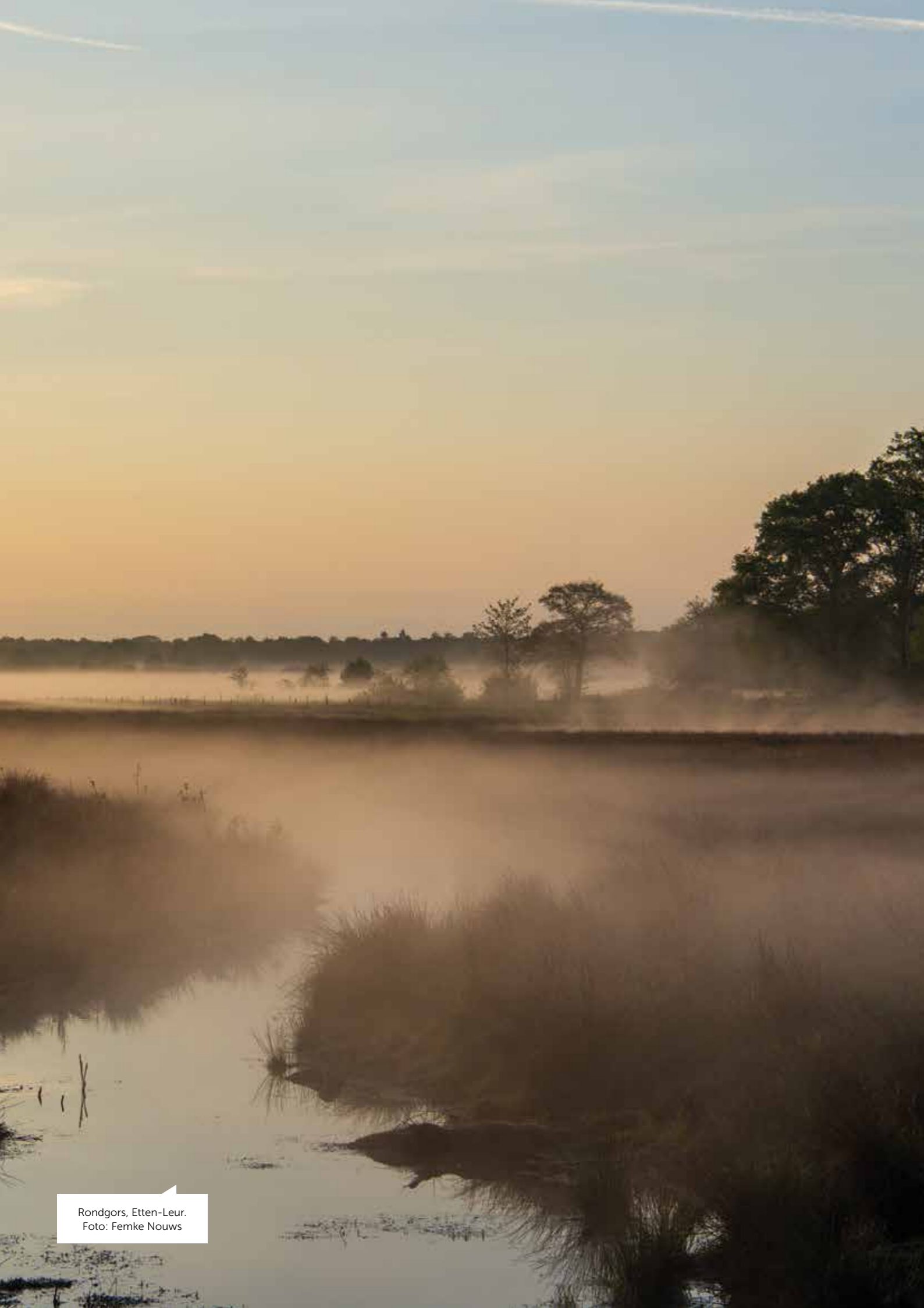
Rondgors, Etten-Leur.