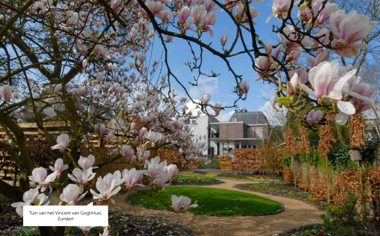
Tuin van het Vincent van GoghHuis, Zundert