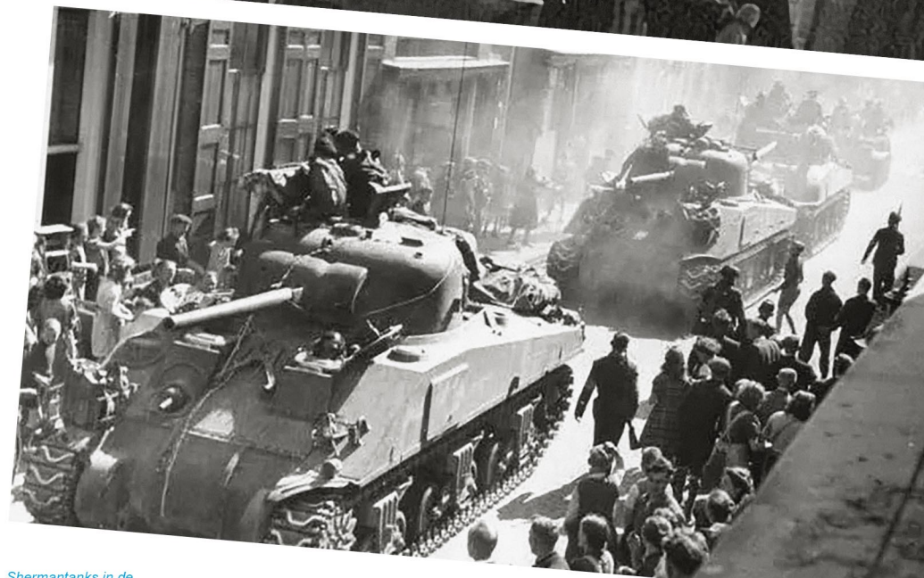
Shermantanks in de Vischpoortstraat in Elburg