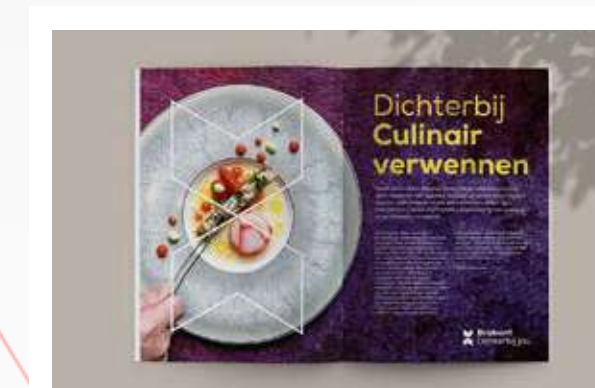
9 Media offline advertorials & advertenties