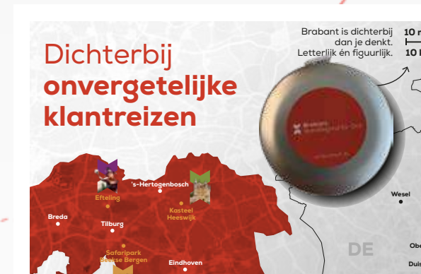
7 Fam Trips OTA's