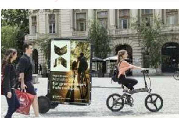
1 Markt activatie Duitsland Essen