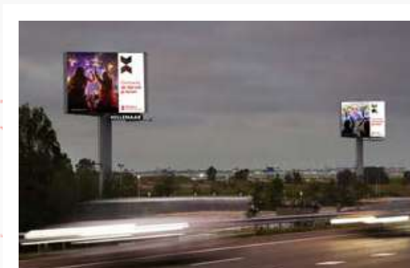
5 Snelwegmasten Nederland Randstad