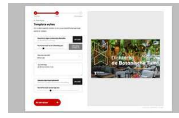
6 B2B activatie met beeldgenerator