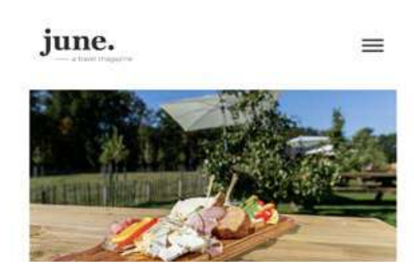
12 Blog & Persreizen