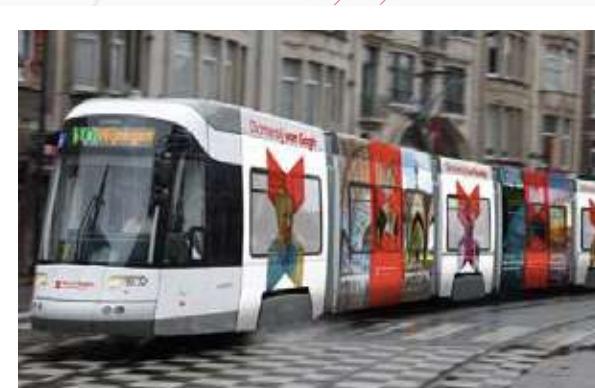
3 Out of Home activatie België Antwerpen & Gent