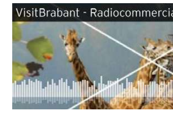
8 Radiocampagne en Podcast