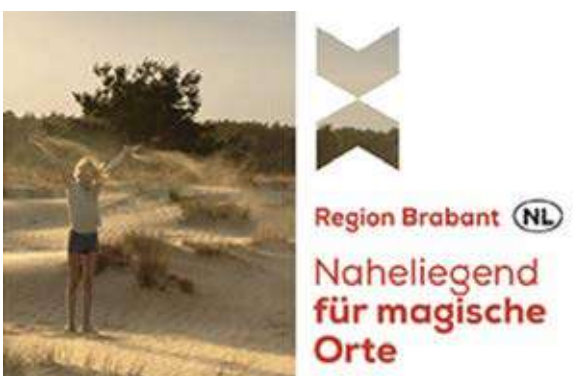
2 B2B2C campagnes Trivago en Holiday Check Duitsland