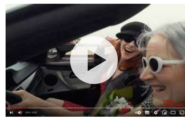
4 Meertalige inspiratievideo's