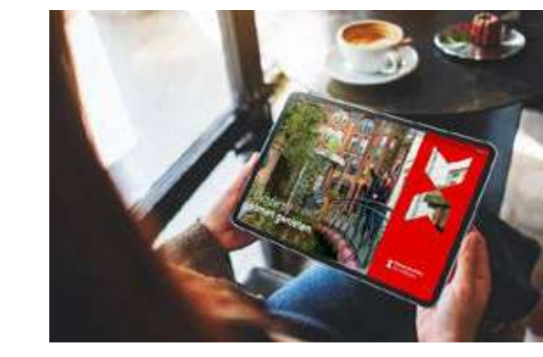
10 Visit Brabant magazine