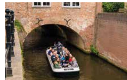
Vaar onder 's-Hertogenbosch door

Dit 600 meter lange fietspad wijst je in het donker de weg dankzij duizenden lichtgevende steentjes, geïnspireerd op het beroemde schilderij 'Starry Night' van Van Gogh.