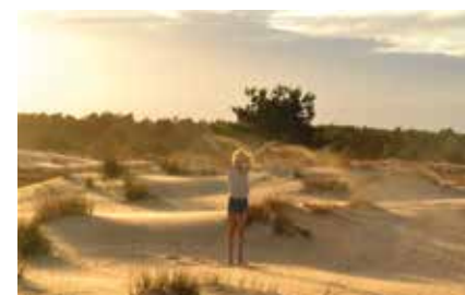
Nationaal Park Loonse en Drunense Duinen