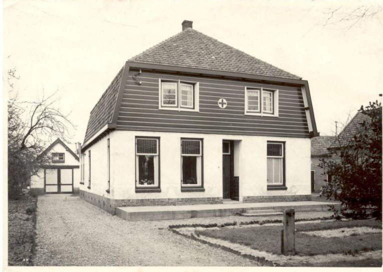
Rijlaan 6, nu: F.H.G. van Itersonlaan 6.

De eerste vereniging “Het Witte Kruis” werd in 1875 in Hilversum op initiatief van dr. J. Penn opgericht en bestreek Noord-Holland. Het waren eerst vooral zusters van verschillende r.k.-orden en diaconessen, die de verzorging van de zieken voor hun rekening namen. Nu namen particulieren het initiatief, om de zeer besmettelijke ziekten zoals tyfus, malaria en TBC te bestrijden.