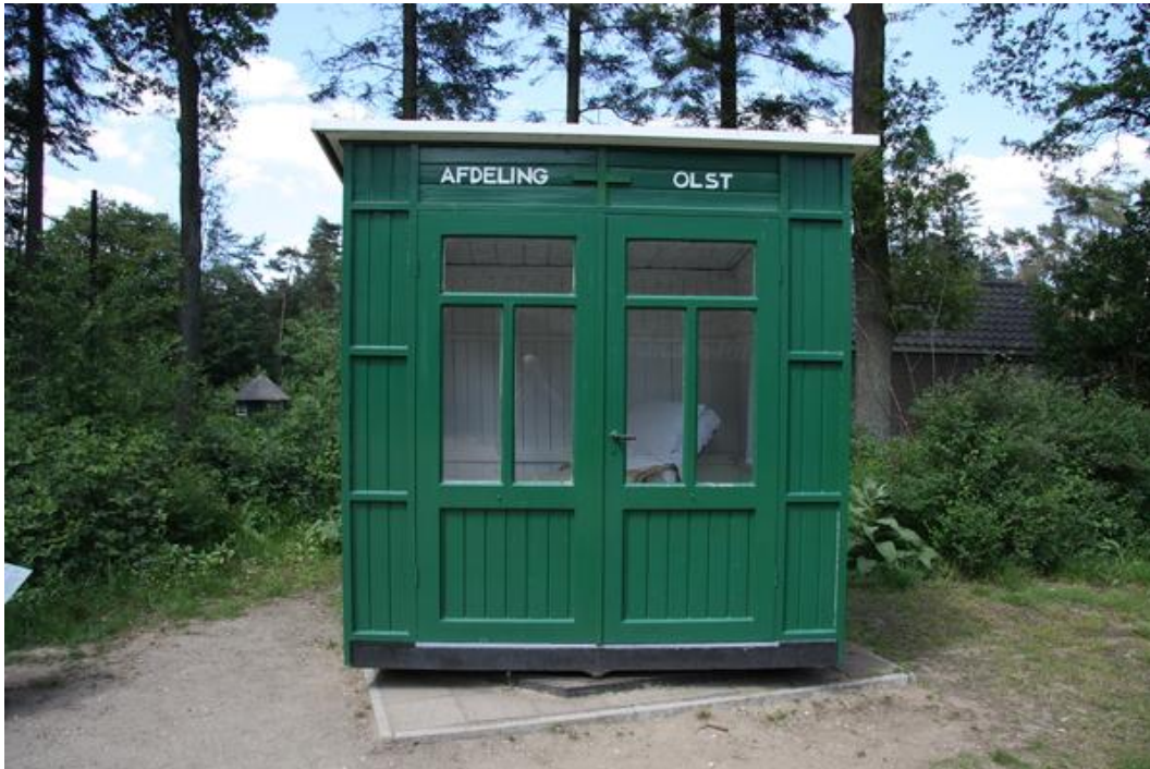
T.b.c.-huisje. Men kon het meedraaien naar de zon.

In de begintijd was het enige wat men kon doen de patiënt veel laten eten, rusten en goede hygiëne, soms in een sanatorium. De longen moesten rust krijgen en dus moest je plat liggen.