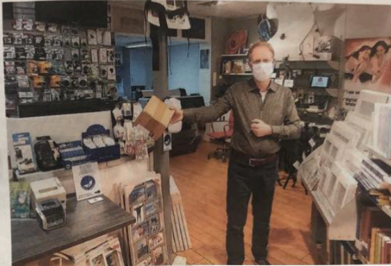
Klanten van winkels in het centrum kunnen hun aankopen zelf ophalen.

WAGENINGEN - Volgens centrummanager Robert Frijlink is het initiatief ontstaan vanuit de winkeliers. "Het aantal online bestellingen is sinds het invoeren van de lockdown flink gegroeid. Daar zijn we heel blij mee, maar sommige winkeliers vinden versturen of bezorgen lastig en duur. In december zijn we al gestart met een bezorgservice via cliënten van Zideris. Daar gaan we zeker mee door, er komen zelfs extra vrijwilligers, maar daarnaast waren extra afhaalpunten een grote wens van de ondernemers. Gelukkig heeft de gemeente hier toestemming voor gegeven. We hopen hiermee dat nog meer inwoners on-