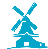
Zaanse schans/ molen