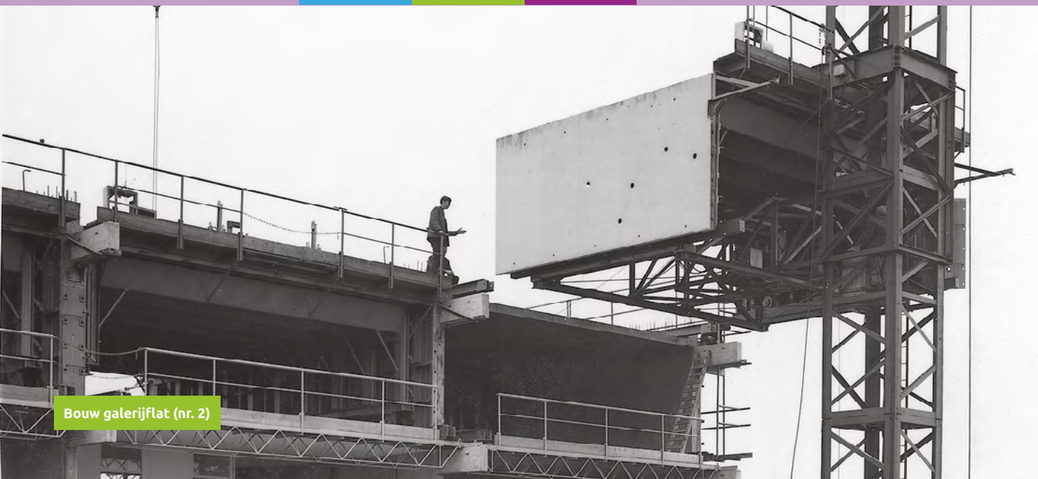
Bouw galerijflat (nr. 2)

Zoetermeer is ontstaan op een hooggelegen veenterp in een groot moerasgebied. In dit relatief hooggelegen deel in het veen was een zoetwatermeer: het 'Soetermeerse meer'. Nadat dit meer tussen 1614 en 1616 is drooggemalen door zogenaamde achtkante riet-gedekte poldermolens is de Meerpolder ontstaan. Er was geen zicht meer op een meer. Wel op een polder. Toch gaat het hier over de wijk met de naam Meerzicht.