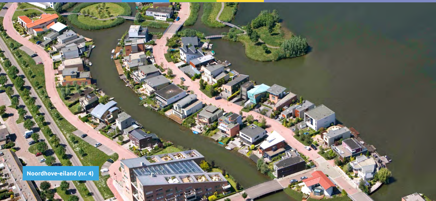
Noordhove-eiland (nr. 4)

Boven de 'ruit' van Seghwaert is Noordhove als een 'taartpunt' op de kaart ontworpen. De naam van de wijk is ontleend aan een boerderij uit 1925 aan de Zegwaartseweg (nr. 15). De ontwikkeling van deze achtste wijk van Zoetermeer is in twee etappen verlopen. Het westelijke deel, Noordhove I, is in de tweede helft van de jaren tachtig gebouwd en het noordelijke en oostelijke deel in de tweede helft van de jaren negentig (Noordhove afronding). De afronding heeft even uitstel gekend omdat door een afspraak met provincie en rijk de bouw van de wijk Rokkeveen voor ging.