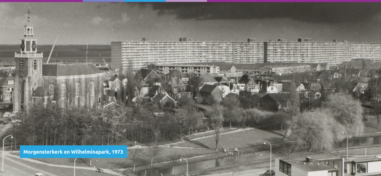
Morgensterkerk en Wilhelminapark, 1973