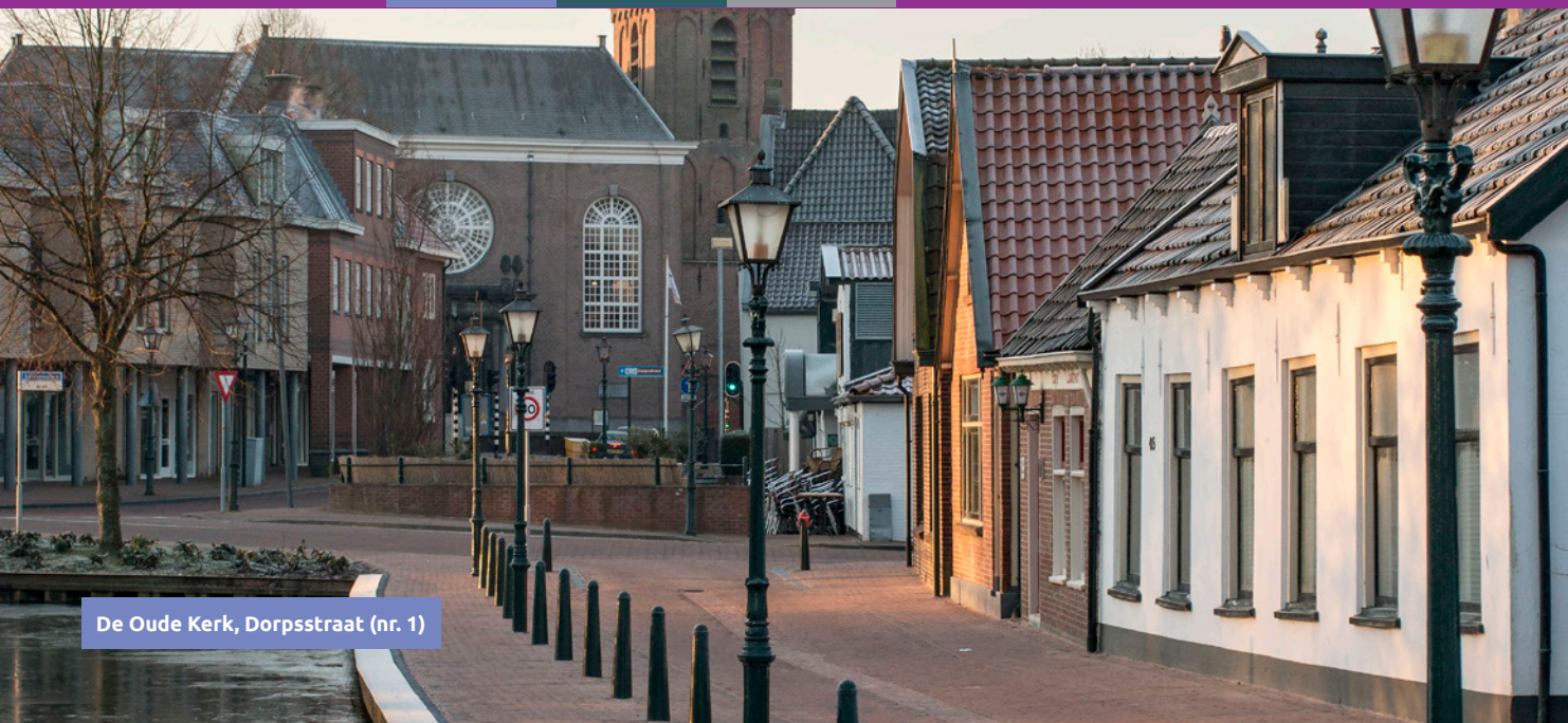
De Oude Kerk, Dorpsstraat (nr. 1)