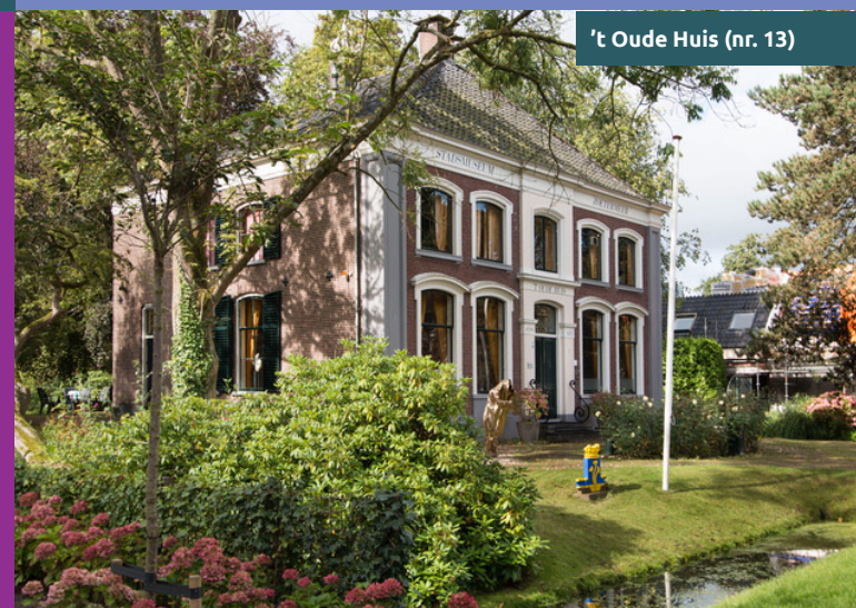
't Oude Huis (nr. 13)

De historie van Zoetermeer begin in de Dorpsstraat. Voeg wat boter, kaas en eieren én een loslopend varken toe, zet er een glazen kaasstolp overheen en je waant je in een compleet dorp zo'n 100 jaar terug in de tijd. Zoetermeer vormde de helft van een zogenaamd tweelingdorp en bestond uit de twee versmolten dorpskernen Zegwaard (arm) en Zoetermeer (rijk). In 1935 zijn ze bestuurlijk samengevoegd tot Zoetermeer. Tijdens deze wandeling wordt de Zoetermeerse Dorpsstraat beleefd als het historische deel van bebouwd Zoetermeer. De route gaat langs gemeentelijke en rijksmonumenten, klein en groot en volgt de buurvaart met twee Dobbe's en verschillende bruggen hieroverheen.