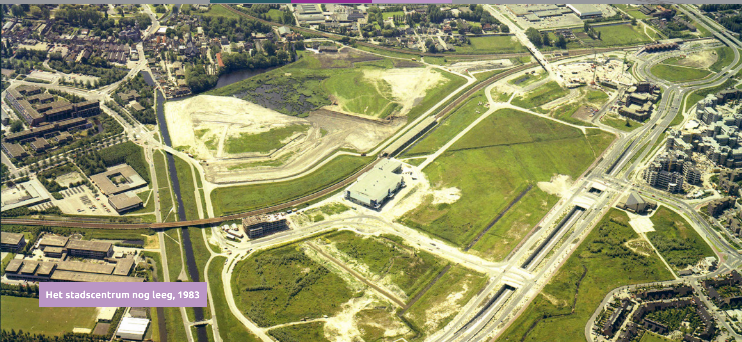
Het stadscentrum nog leeg, 1983

Uniek voor Zoetermeer zijn haar oude dorpskern en oude infrastructuur zoals de Delftse- en Leidswallenwetering midden in een nieuwgebouwde stad. Bijzonder is de ligging van haar nieuwe stadskern. Zes meter boven het zogenaamde maaiveld met een 'bovenstad' en een 'benedenstad'.