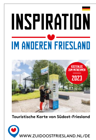
INSPIRATIEKAART NEDERLANDS EN DUIJS