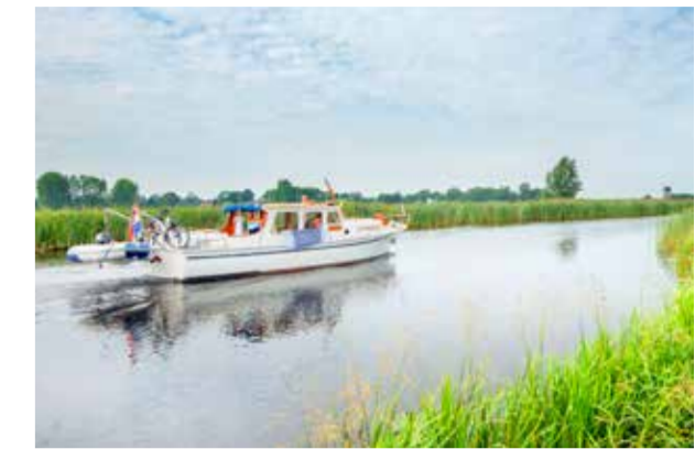
Turfroute kaart van Zuidoost Friesland