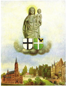
Deze Maria — afbeelding is gemaakt naar een foto van 1 aloude beelde boven de ingangspoort achter de ophaalbrug van 't kasteel van Gemert gebouwd in — 1380, het schild onder Maria's rechterarm geeft 't wapen der Duitse ridders, op 't schild onder het Kinde staat 't wapen van Gemert soeter tyd, daarom mag deze voorstelling Maria Teutonica — Onze Lieve Vrouw van Gemert worden gebeten.

Voor meer info kunt u terecht op de website van “het land van de Peel” en /of in het centrum bij de VVV.-kantoor. En natuurlijk bij: